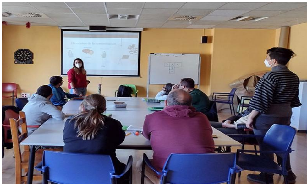
El curso ha sido impartido en Valentia.

El curso ha sido impartido a través del proyecto SE CANTO.