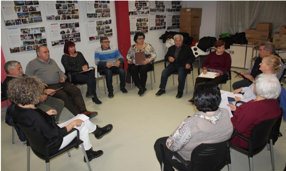
El grupo, en una de las sesiones realizadas.

El centro Reina Sofía de Monzón concluye la experiencia.