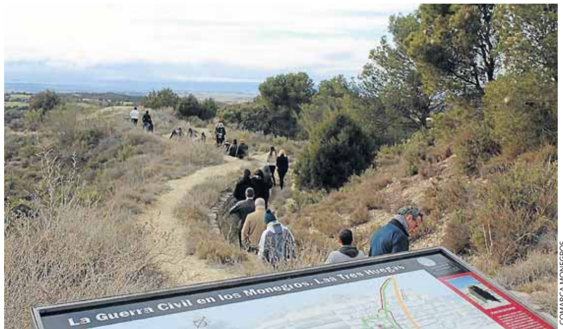
La visita concluyó con un recorrido por las trincheras de la Ruta Orwell.