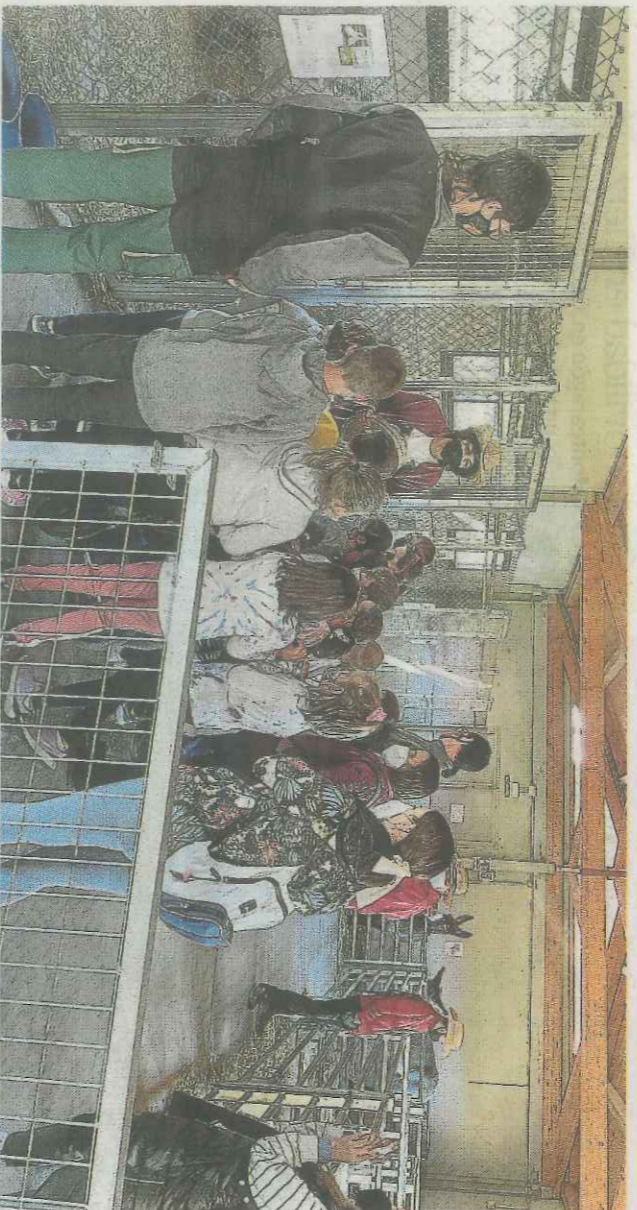
Los usuarios de Valentia llevaron a los niños a la granja del centro de Martillué.