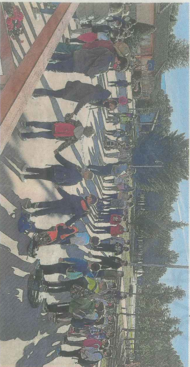
El proyecto piloto concluyó con una jornada de convivencia en el centro de Valentia en Martillué.