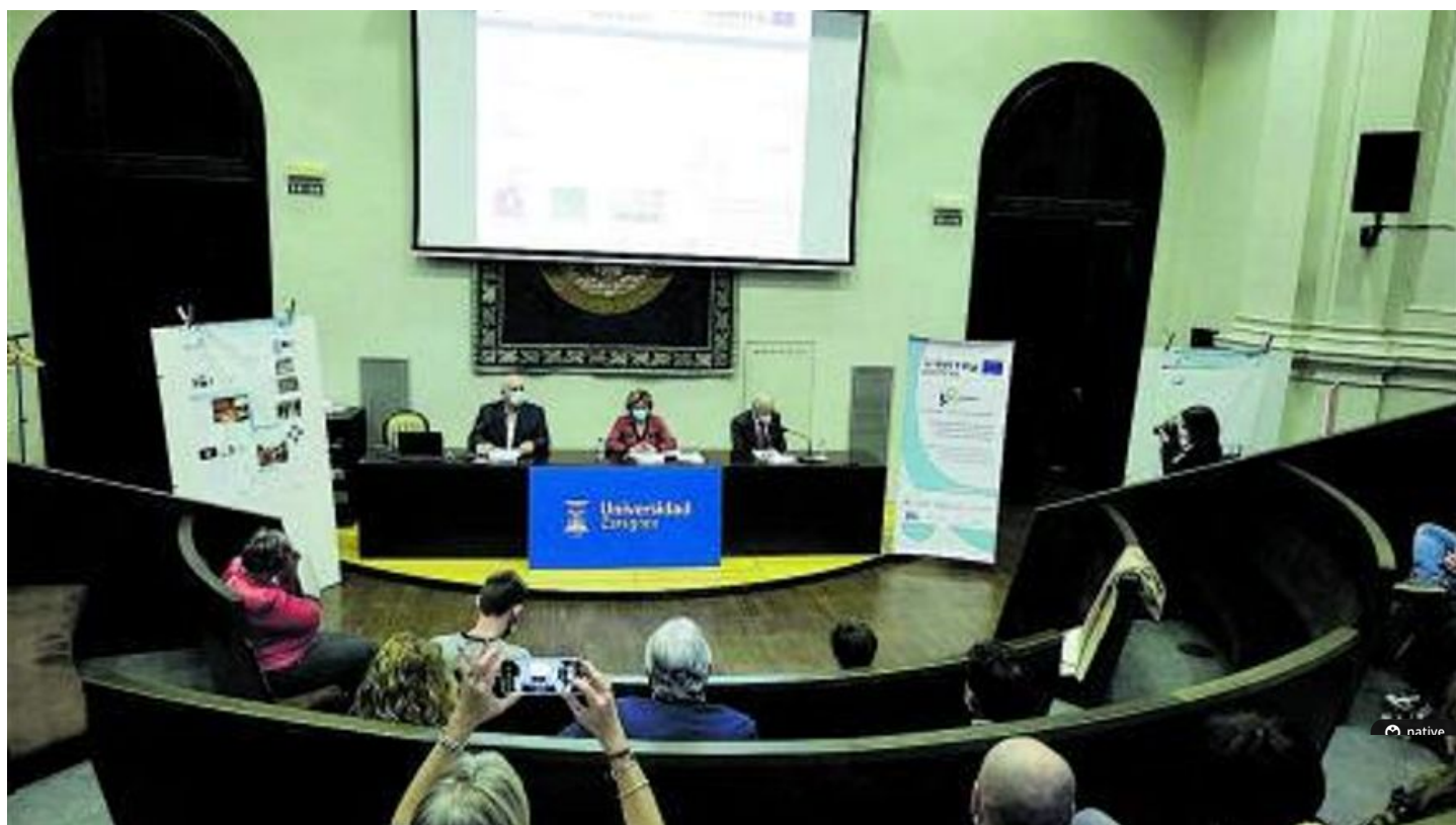
Clausura del proyecto Se Canto, en la Universidad de Zaragoza.

E l proyecto europeo Se Canto, Senda Europea de Cooperación, Ayuda y Normalización entre Territorios de Oportunidades, ha analizado y estudiado distintas líneas estratégicas de formación y empleo para mejorar la calidad de vida de las personas más vulnerables en el medio rural. Este análisis lo ha desarrollado el Grupo de