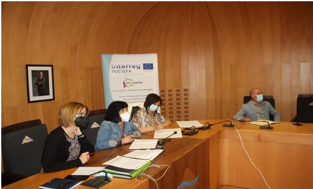
Socios de Monegros durante la reunión técnica del proyecto.

Sendos cursos de atención social en España y Francia.