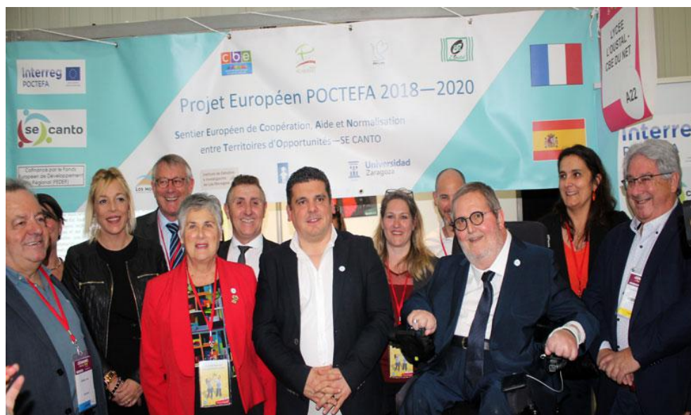
Foto de familia en la inauguración del stand.

Se titula «La espiral de Ana» y ha sido presentado en Grañén